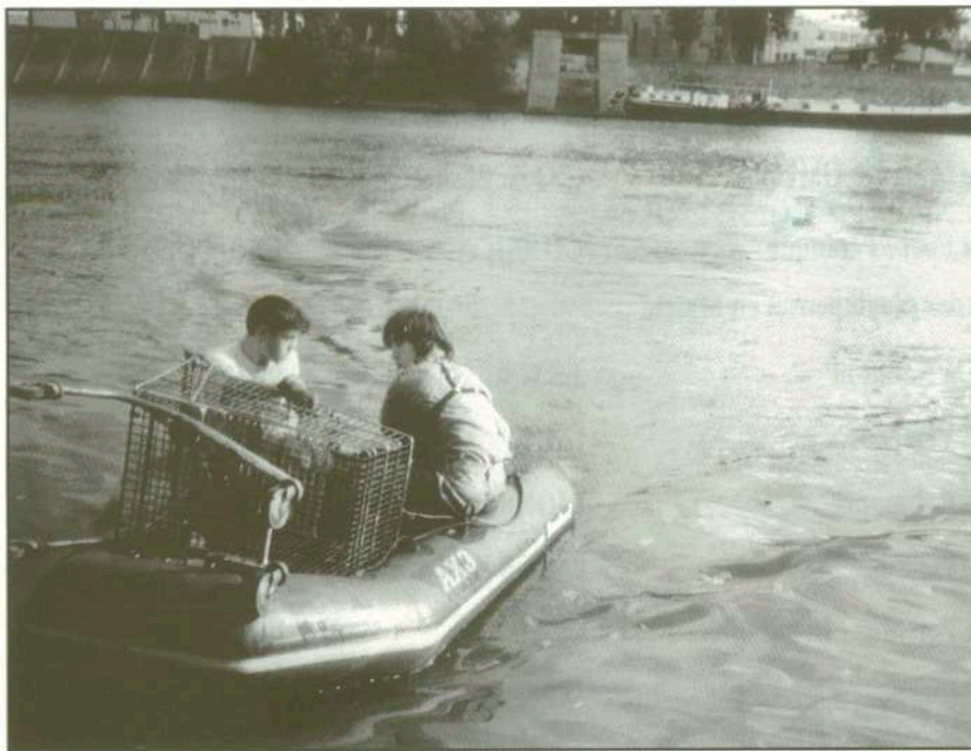
Les jeunes de l'association O.S.E. au cours de leur "pêche miraculeuse".

Loin d'être de doux rêveurs, les adhérents de l'Association O.S.E. pratiquent l'écologie au quotidien en débarassant les berges et les fleuves des tonnes de débris jetés là par négligence coupable. Leur bilan se traduit en une vingtaine d'opérations de nettoyage dont le résultat est édifiant: 27 tonnes de débris divers récoltés sur 6 000 m 2 entre Alfortville, Vitry et Ivry. Réfrigérateurs, portails, lave-linges, roues de camions, machines à coudre, poussettes, caddies ne sont qu'une partie des "trouvailles" extraites de la Seine, de la Marne et de leurs berges. Cette tâche harassante et ingrate ne décourage pas nos "militants de la propreté". Bien au contraire, ils se mobilisent pour la Journée de la Terre le 22 avril 1992. L'association recherche des jeunes qui veulent participer à l'opération de récupération d'objets flottants au départ d'Alfortville, tout au long de la Seine jusqu'à Paris.