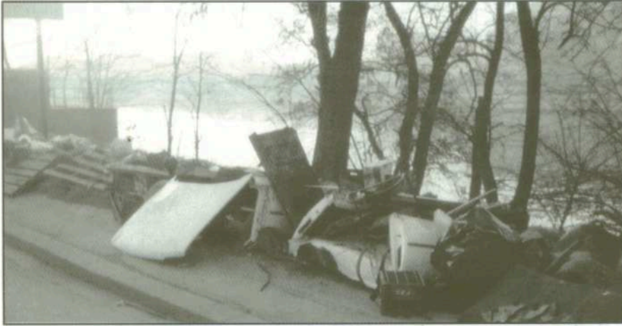
Les quais et les berges, reflets de la négligence des hommes.